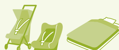
유모차·베이비 카시트 이불