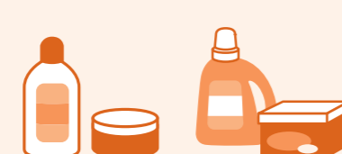
护肤用品 洗洁剂类