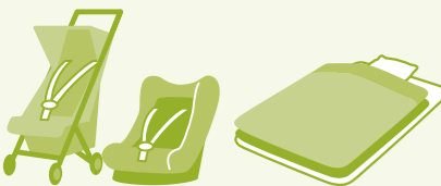
婴儿车、婴儿汽车座椅 被子