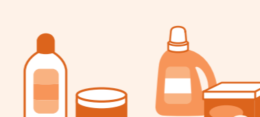
護膚品類 清潔劑類